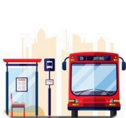
parada de autobús