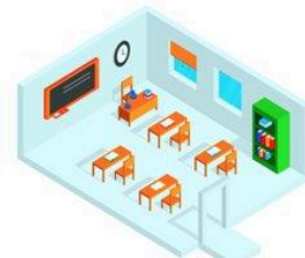
salón de clases